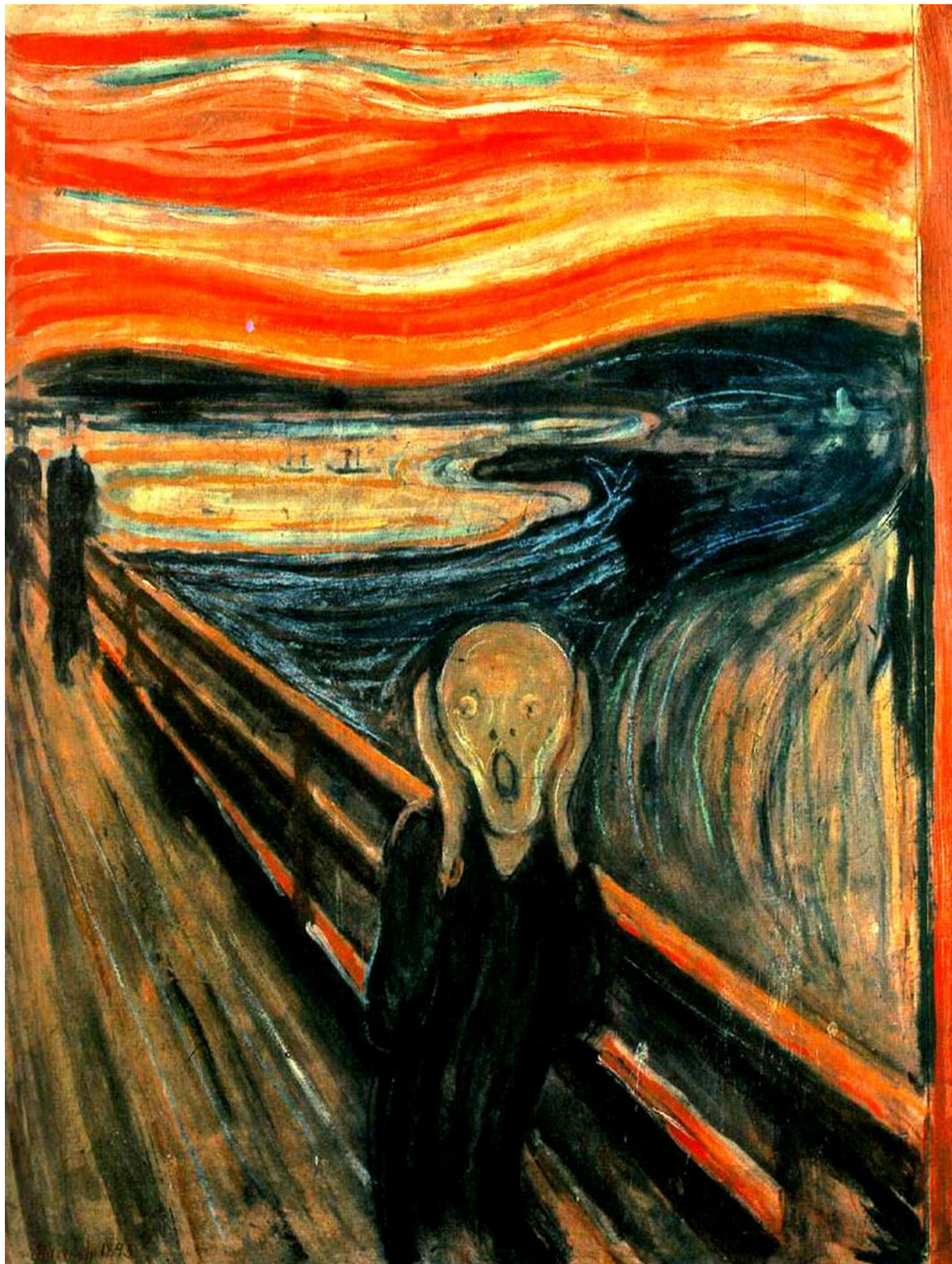
E. Munch - Výkřik