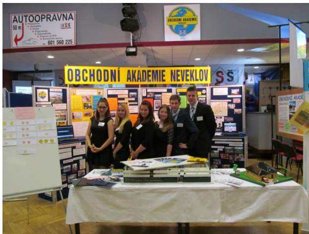
Burza škol, KD Karlov BN